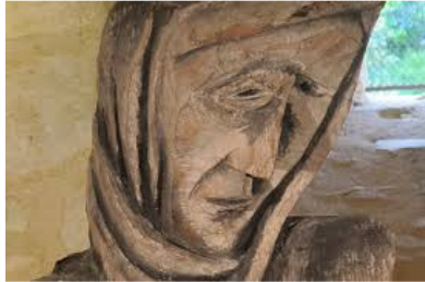
Ids Willemsma Doodskisten